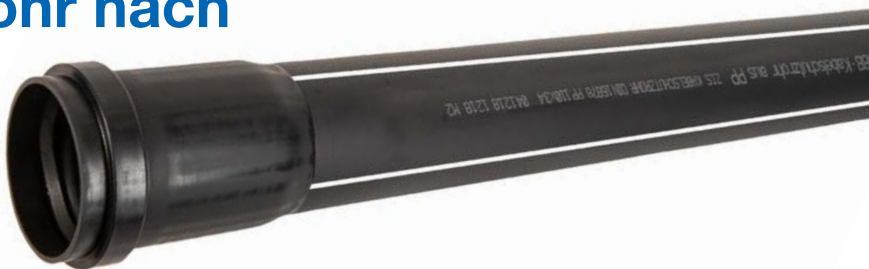
Die neue ÖBB Spezifikation gibt es seit Herbst 2018, das entsprechende Rohr ist seit kurzem bei Pipelife Austria erhältlich. Ein PP-Kabelschutzrohr mit Langmuffe und vier weißen Längsstreifen. Bestellbezeichnung z.B. PP110-6-ÖBB

Dabei handelt es sich um ein Rohr nach DIN 16878 mit einer angeformten Langmuffe. Für dieses Rohr ist neben Neuware auch der Einsatz von Umlauf- oder Recyclingmaterial zulässig, wenn bestimmte Werkstoffkenndaten eingehalten werden. Es ist für alle drei beschriebenen Dimensionen (DN/OD 110,