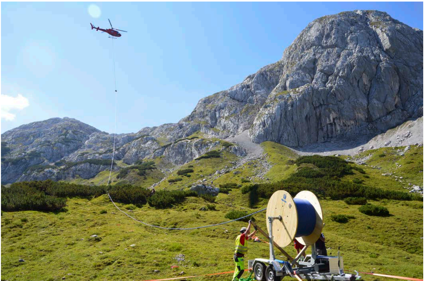
Drei Holztrommeln mit je 600 m langen Rohren wurden mit dem Hubschrauber auf die Alm transportiert, auf einen Spezialanhänger aufgespannt und im Boden verankert. Das Ausrollen der Leitung erfolgte mittels Hubschrauber.

Im Auftrag der Naturfreunde Salzburg wurde eine neue Wasserleitung für das Leopold Happisch Haus errichtet. Dabei kam ein Schutzmantelrohr aus dem Lieferprogramm von Pipelife Austria zur Anwendung. Das Besondere dabei: Der Transport und die Verlegung der Rohrleitung erfolgte per Hubschrauber.