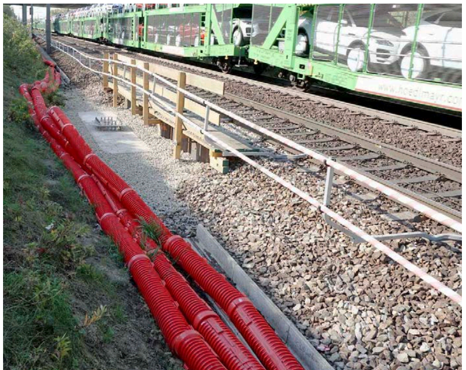
DIVIO® Halbrohre schützen in der Bauphase die umgelegten Kabel.

DIVIO® wird nach dem Normentwurf EN 50626-1 gefertigt und erfüllt die ÖBB Spezifikation. Diese schreibt die Prüfung der Druckfestigkeit in Anlehnung an die ÖNORM EN 61386-24 vor. Dabei muss eine Kraft von mind. 1.000N aufgebracht werden, um eine Abflachung der Rohre um 5% zu erreichen. DIVIO® erfüllt diese Anforderung bestens. Die Konstruktion der sanddichten Verbindungsmuffen erlaubt eine Abwinkelung des Rohrsystems von bis zu 15°. Das erspart die Verwendung zusätzlicher Bögen.