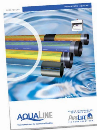
Eine Übersicht über unser AQUALINE-Sortiment finden Sie in der Produktinfo.

Rohre: Fabrikat egeplast; PE100-RC Schutzmantelrohr DN/OD32 SDR11