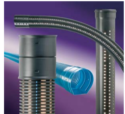
Dränage Stange und Rolle