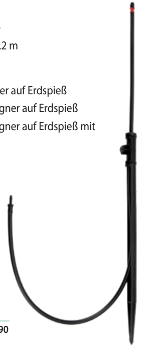
Jet Spike 310-90