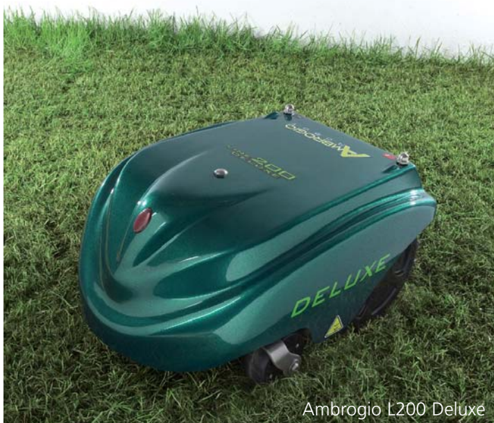
Ambrogio L200 Deluxe