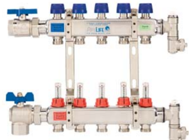
Edelstahlverteiler mit geradem und gewinkelttem Kugelhahn.