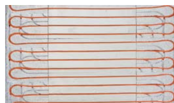
Multiklemm-Systemplatte für Trockenestrich