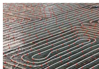
Stahldraht-Gittermatte System FT-ESK