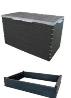
ROM-BOX 4, 75 x 155, inkl. Abdeckung und Höhenausgleich 0-50 mm

Die ROM-BOX wird komplett vormontiert geliefert. Bitte bei der Bestellung die Gesamtbauhöhe angeben.