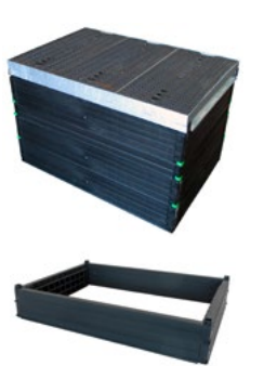
ROM-BOX 3, 75 x 115, inkl. Abdeckung und Höhenausgleich 0-50 mm

Die ROM-BOX wird komplett vormontiert geliefert. Bitte bei der Bestellung die Gesamtbauhöhe angeben.